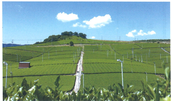
◎歩きやすいお履物でご参加ください。