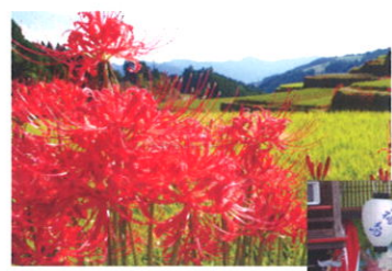
星野村 鹿里彼岸花