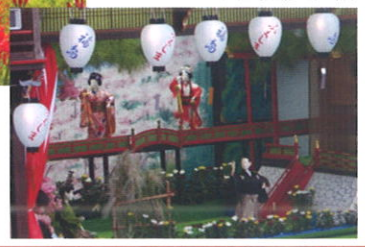
八女福島燈籠人形公演

ツアー料金/お1人様 ▶ 2,500円 ※消費税別 定員/ 22名 ※地域住民生活等緊急支援のための交付金により、2,500円を助成しています。