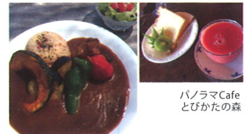
パノラマCafe とびかたの森