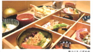
季ごころくぼやま

お申し込みは FAX でのお申し込みのみとなっています。裏面の申し込み用紙にご記入の上、各ツアー申込み締め切り日までに「茶のくに観光案内所」まで FAX 願います。申込み多数の場合は抽選となりますので、当選された方には、後日お電話にてご連絡致します。