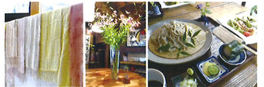
草木染め体験(写真はイメージ)