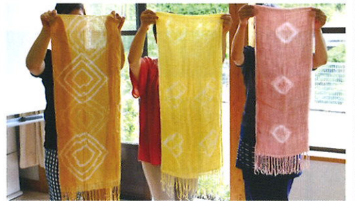
草木染め体験(写真はイメージ)