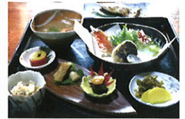
柚人の家のお食事はイメージ写真です