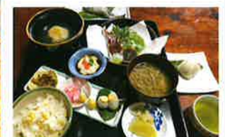
柚人の家 ※写真はイメージです