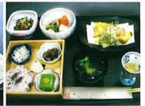
八女茶寮 ※写真はイメージです