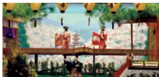
福島燈籠人形【国指定重要無形民俗文化財】