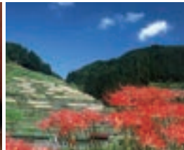
星野村鹿里の棚田