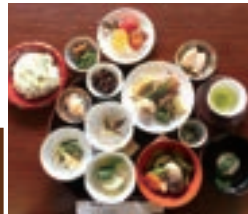
大円寺の精進料理 ※写真はイメージ