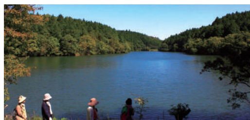
善蔵池を周回する全長2,260mのロードです