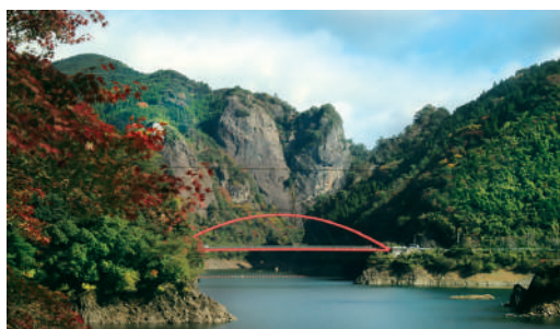
日向神峡にあるハート岩を望む「けほぎ橋」