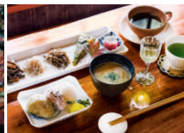
茶寮 千代乃園のランチ(イメージ)