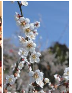
夢たちばな観梅会