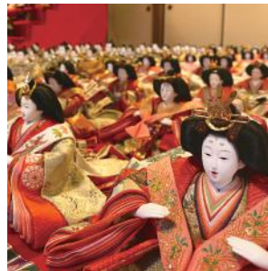
雛の里 八女ぼんぼりまつり