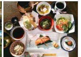
酒邸 吟乃香(イメージ)