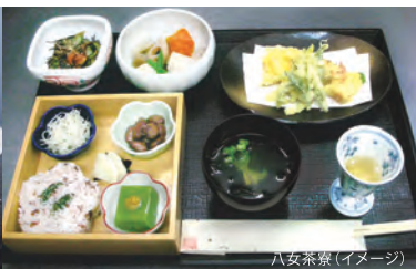
八女茶寮(イメージ)