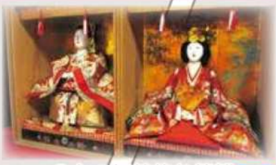
八女の伝統的な箱雛