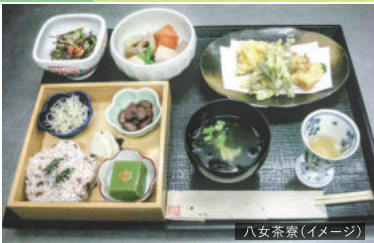
八女茶祭(イメージ)